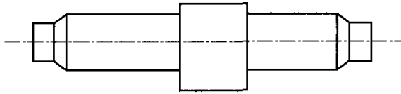
图 3 偏心轴

偏心轴：偏心量为 (20 \sim 30)\mu\text{m} ，其测量值的扩展不确定度不大于 1\mu\text{m} ( k=3 )，轴外圆相对顶尖孔的圆跳动不大于 1\mu\text{m} ，见图 3。